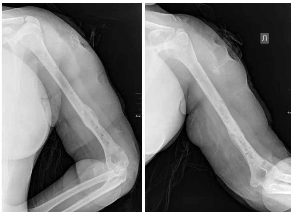
Рис. 4. Пациентка Д., рентгенограммы левой плечевой кости после демонтажа чрескостного аппарата Fig. 4. Patient D., X-ray scans of the left humerus after removal of the external fixation device

Схема чрескостного остеосинтеза левой плечевой кости выглядит следующим образом: