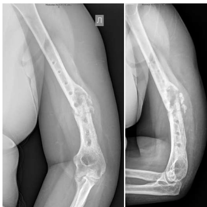
Рис. 1. Пациентка Д. Рентгенограммы левой плечевой кости при обращении в ИНЦХТ

После обработки операционного поля на II уровне плечевой кости на позиции 11 ч в направлении спереди назад и на III уровне плечевой кости на позиции 9 ч в направлении снаружи внутрь под углом 90° к длинной оси кости сформированы каналы (сверлом диаметром 3,0 мм), проходящие через обе кортикальные пластинки, и введены 2 винтовых стержня (диаметром 5,0 мм). Проведённые чрескостные элементы фиксированы при помощи консольных приставок в секторе аппарата внешней фиксации, расположенном перпендикулярно длинной оси кости. Сформирована проксимальная опора чрескостного аппарата. При помощи соединительных стержней установлены кольцевые опоры аппарата на IV и VI уровнях плечевой кости, на VIII уровне установлена опора, составляющая 3/4 кольца. На VIII уровне плечевой кости, в плоскости внешней опоры, проведена спица с упорной площадкой в направлении 3-9 перпендикулярно дистальному отломку, закреплена фиксаторами (натяжение 110 кг). На VII уровне на позиции 8 ч сверлом